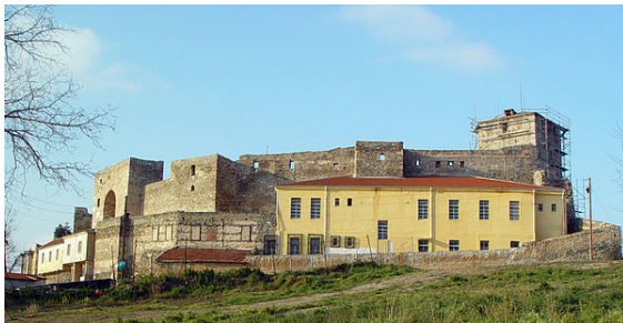
El Heptapyrgion o fortaleza bizantina de siete torres.

Tras la caída del Imperio de Occidente, quedó en manos del Imperio bizantino y fue asediada por los eslavos en el siglo VII. Aunque no pudieron conquistar la ciudad, finalmente una considerable comunidad eslava se estableció en ella. Los santos Cirilo y Metodio nacieron en Tesalónica y el emperador bizantino Miguel III los envió a las regiones eslavas del norte como misioneros del cristianismo. De la época bizantina son los mosaicos conservados en la basílica de Hagia Sophia y en la iglesia de San Jorge . La ciudad fue ocupada por los árabes en 904 y por los reyes normandos de Sicilia en 1185, causando considerable destrucción y pérdida de vidas humanas. En 1204, con la caída del Imperio bizantino debido a la conquista de Constantinopla por parte de la Cuarta Cruzada, Tesalónica y su territorio circundante —el reino de Tesalónica— se convirtió en la mayor posesión del Imperio latino. Sin embargo, fue conquistada en 1224 por el Despotado de Epiro que la mantuvo hasta 1246, cuando fue recuperada por los bizantinos, los cuales, incapaces de mantenerla, se la vendieron a Venecia .