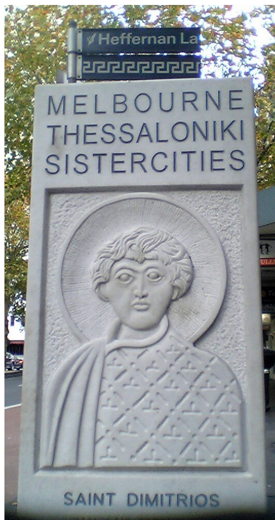
Monolito conmemorativo en Melbourne.

Salónica está hermanada con las siguientes ciudades: [15]