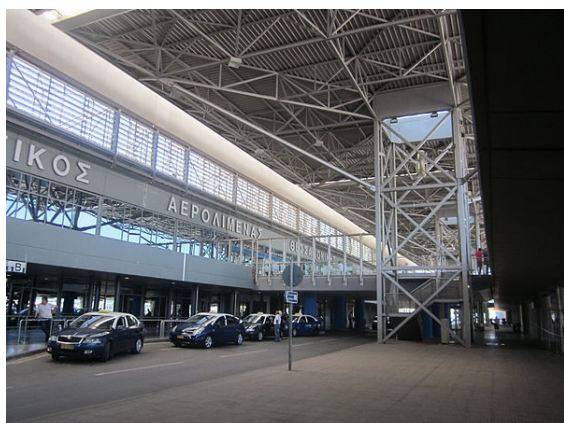
Aeropuerto Internacional "Macedonia" de Salónica.