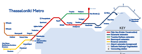
Mapa del Metro de Salónica.