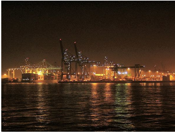
Puerto de Waalhaven, visto en la noche.

La ciudad de Róterdam hace uso de los servicios de empresas semi-gubernamentales como Roteb (cuidado de saneamiento, gestión de residuos y servicios clasificados) y la Autoridad del puerto de Róterdam (para mantener el puerto). Ambas empresas fueron una vez los órganos municipales, ya que son entidades autónomas y propiedad de la ciudad.