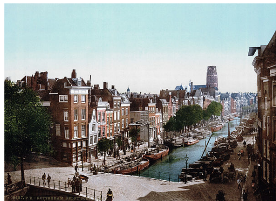
La ciudad al final del siglo XIX.

En el siglo XIX , la posición de Róterdam como puerto internacional fue amenazado por el sedimento de la población en los principales enlaces con el mar. Entre 1827 y 1830 bajo el reinado de Guillermo I y con el fin de superar este problema, el ingeniero Pieter Caland diseñó un ambicioso plan para una nueva conexión con el mar del Norte. En 1866 comenzó la ejecución, y entre 1866 y 1872 el nuevo canal fue excavado. Esto creó un enlace marítimo directo entre Róterdam (como entidad de Holanda) y el Mar del Norte. Después de la apertura del canal comenzó la nueva aceleración del crecimiento en la