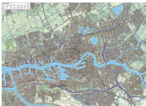
Mapa topográfico de Róterdam (tomado en 2011).

Róterdam se divide de norte a sur por el río Nieuwe Maas, conectadas de oeste a este por el Beneluxtunnel, el Maas-tunnel, el Erasmusbrug (Puente Erasmus), un túnel de metro, el Willemsspoortunnel (túnel ferroviario), el Willemsbrug, el Koninginnebrug (Puente de la Reina), y el Van Brienenoordbrug. El antiguo puente ferrocarril De Hef (el Levante) se conserva como un monumento en una posición elevada entre el Noordereiland (Isla del Norte) y el sur de la ciudad.