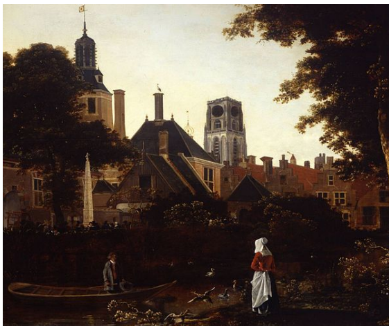
Paisaje urbano de 1660, en el fondo se observa la torre de la iglesia de San Lorenzo.

Alrededor de 1260, la por entonces Rotte, fue una presa situada en el lugar donde el Hoogstraat Rotte cruzaba. Esto dio al nombre de Rotterdam o en español Róterdam. Rodeando la presa había un asentamiento donde se vivía inicialmente de la pesca. Pronto el lugar se convirtió en un mercado y creó los primeros puertos. El 17 de marzo 1299 Róterdam pasa al poder del conde Juan de Holanda . El 7 de junio de 1340 se concede el poder finalmente a William IV de Holanda . En 1360, fue construida una muralla. Durante el conflicto entre 1488 y 1490, van Brederode jugó un papel importante en Róterdam. La posición como base de las guerras fortaleció a la ciudad enormemente en comparación con otras ciudades de los alrededores, por lo tanto la vecina Delft perdió la mitad de la población. Gracias a van Brederode la ciudad toma importancia en Holanda .