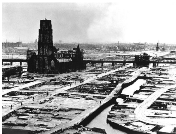
Centro de Róterdam, después de la limpieza de escombros.

Todo cambió el 14 de mayo de 1940. Después de varios días de intensos combates alrededor del puente, en la mañana del 14 de mayo de 1940, fue amenazada con la destrucción de la ciudad. Los alemanes parecían tener poca paciencia para llevar a cabo su amenaza, el bombardeo de Róterdam tuvo lugar en la tarde, duró sólo quince minutos, pero los efectos destructivos que originó el fuego fueron enormes. Más de 24 000 viviendas fueron reducidas a cenizas. Alrededor de 800 personas murieron y